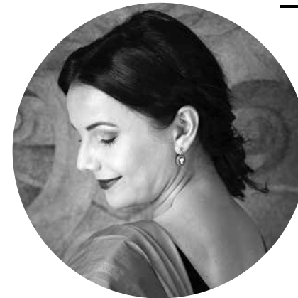
for Marek Hofman

Sie ist Studentin an der Musikhochschule in Warschau. Zuvor absolvierte sie die Fächer Violine und Gesang an der Staatlichen Musikschule in Olsztyn. Im Jahr 2023 debütierte sie an der Polnischen Königlichen Oper in Warschau in der Rolle der Pamina in Mozarts Die Zauberflöte . Zu ihren weiteren Rollen zählen Genoveva in Puccinis Suor Angelica (am Großen Theater – Nationaloper Warschau sowie am Großen Theater in Łódź) und der Küchenjunge in Dvořáks Rusalka im Radziwiłł-Palast in Nieborów. Sie trat außerdem als Gastsolistin mit dem Orchester der Philharmonie von Ermland und Masuren auf. Sie ist Preisträgerin zahlreicher Wettbewerbe, darunter der Spezialpreis (eine Einladung zum Debüt an der Baltischen Oper) beim 1. Internationalen Gesangswettbewerb „Voice & Villas“ (2024) sowie der zweite Platz beim Nationalen Wettbewerb „M. Fołtyn“ in Radom. Seit 2020 ist sie Stipendiatin des Rektors der Musikhochschule Warschau und der Stiftung „Fond der Olsztyner Region“.